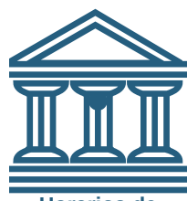
Horarios de Corte