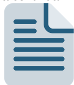
Bono de Reconocimiento personal