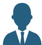
Abogado efectivo y gratuito

Julio 2019: Si se aprueba el decreto de consentimiento, el Condado de Harris sería uno de los condados más grandes del país en limitar severamente el uso de la fianza en efectivo.