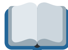
Reglas & Pólizas